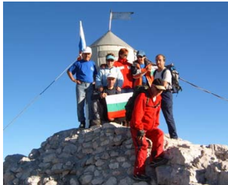
на връх Триглав